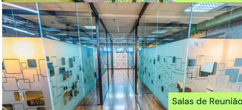
Salas de Reunião