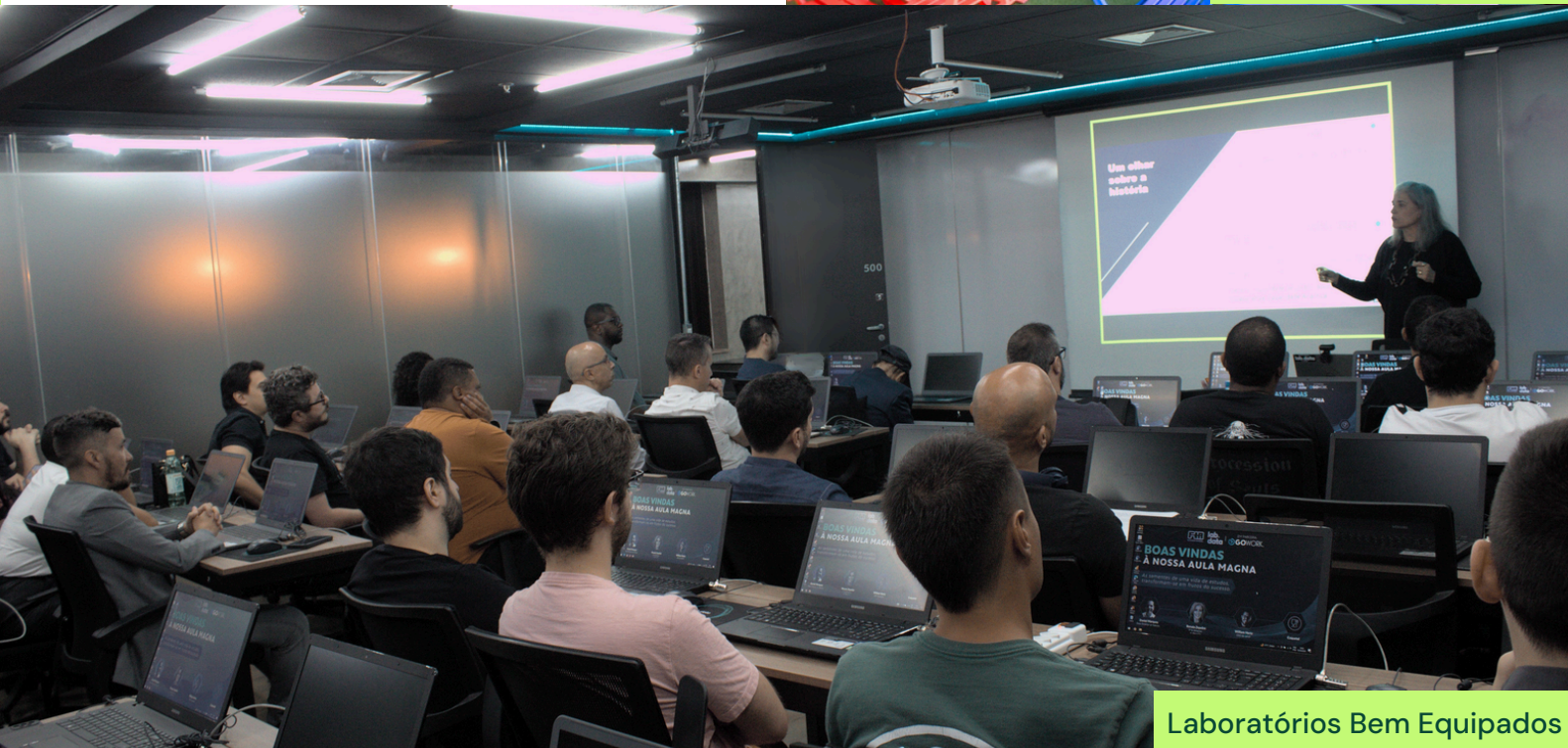
Laboratórios Bem Equipados