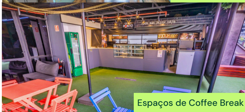
Espaços de Coffee Break