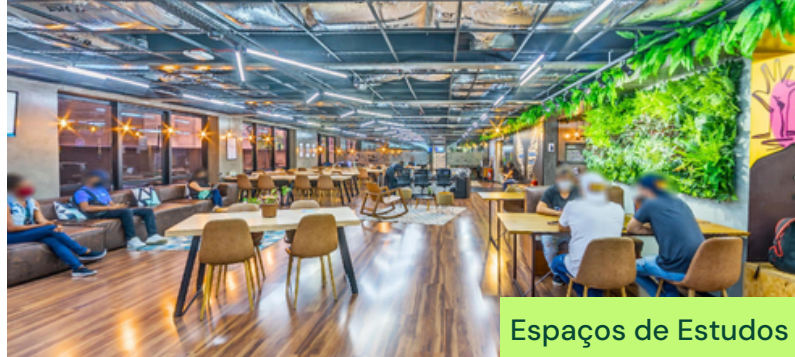
Espaços de Estudos

Localizado na Avenida Paulista e na Avenida das Nações Unidas, nossos laboratórios contam com equipamentos individuais, segurança, áreas de lazer e networking para nossos alunos e professores.