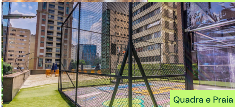
Quadra e Praia