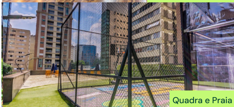
Quadra e Praia