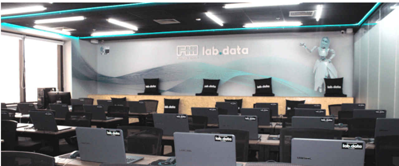
Área para Networking

A parceria Labdata e GoWork traz para o ecossistema do coworking, um núcleo de educação executiva, onde pesquisadores, empreendedores e estudantes contribuem para a maximização dos resultados criando um ambiente de busca por conhecimento, sintetizado em muitos eventos, hackathons, aulas de alto nível e amplo espaço para networking. Localizado na Avenida Paulista , nossos laboratórios contam com equipamentos de última geração, conforto e segurança para nossos alunos e professores.