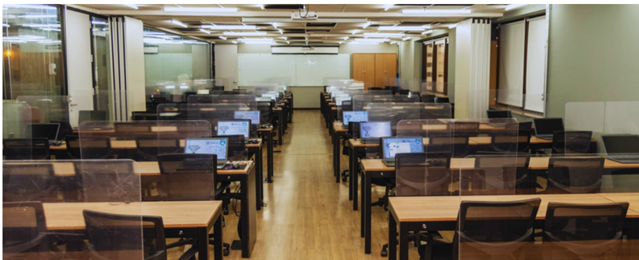
Área para Networking

A parceria Labdata e GoWork traz para o ecossistema do coworking, um núcleo de educação executiva, onde pesquisadores, empreendedores e estudantes contribuem para a maximização dos resultados criando um ambiente de busca por conhecimento, sintetizado em muitos eventos, hackathons, aulas de alto nível e amplo espaço para networking. Localizado na Avenida Paulista , nossos laboratórios contam com equipamentos de última geração, conforto e segurança para nossos alunos e professores.