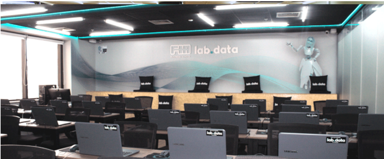
Área para Networking

A parceria Labdata e GoWork traz para o ecossistema do coworking, um núcleo de educação executiva, onde pesquisadores, empreendedores e estudantes contribuem para a maximização dos resultados criando um ambiente de busca por conhecimento, sintetizado em muitos eventos, hackathons, aulas de alto nível e amplo espaço para networking. Localizado na Avenida Paulista , nossos laboratórios contam com equipamentos de última geração, conforto e segurança para nossos alunos e professores.