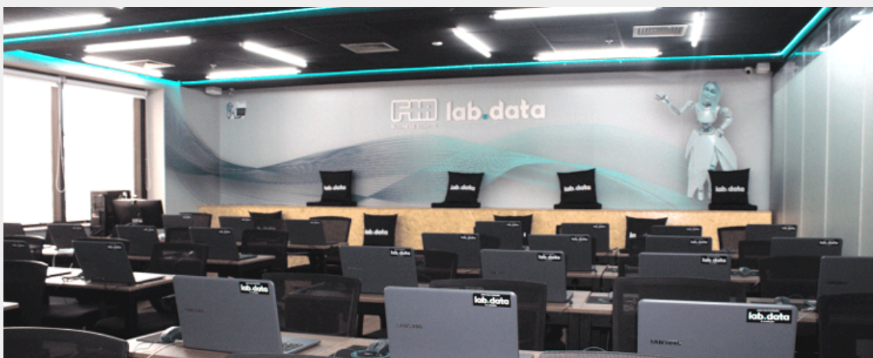
Área para Networking

A parceria LABDATA e GoWork traz para o ecossistema do coworking, um núcleo de educação executiva, onde pesquisadores, empreendedores e estudantes contribuem para a maximização dos resultados criando um ambiente de busca por conhecimento, sintetizado em muitos eventos, hackathons, aulas de alto nível e amplo espaço para networking. Localizado na Avenida Paulista , nossos laboratórios contam com equipamentos de última geração, conforto e segurança para nossos alunos e professores.