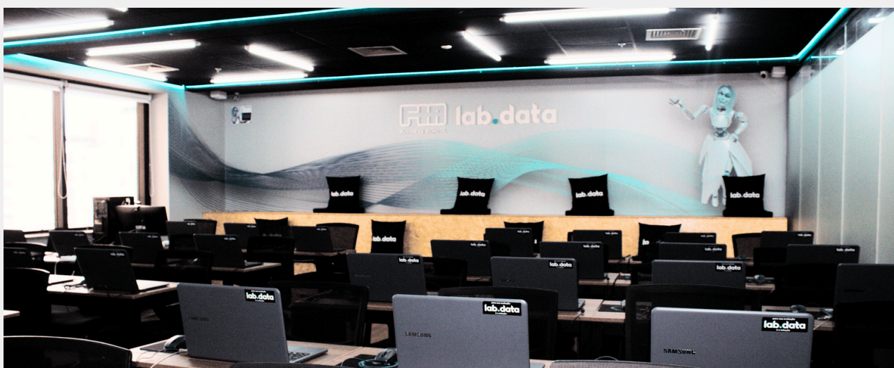
Área para Networking

A parceria LABDATA e GoWork traz para o ecossistema do coworking, um núcleo de educação executiva, onde pesquisadores, empreendedores e estudantes contribuem para a maximização dos resultados criando um ambiente de busca por conhecimento, sintetizado em muitos eventos, hackathons, aulas de alto nível e amplo espaço para networking. Localizado na Avenida Paulista , nossos laboratórios contam com equipamentos de última geração, conforto e segurança para nossos alunos e professores.