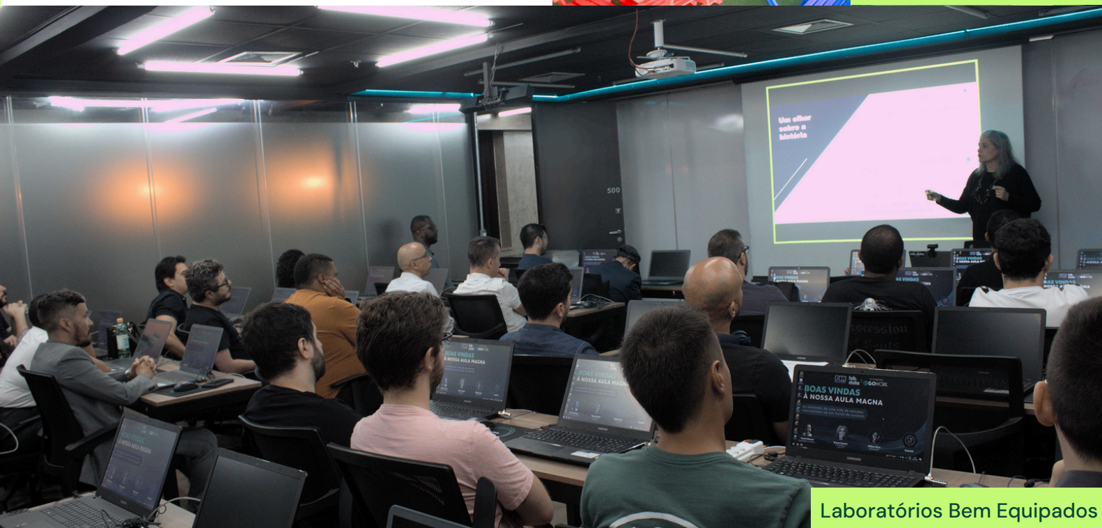
Laboratórios Bem Equipados