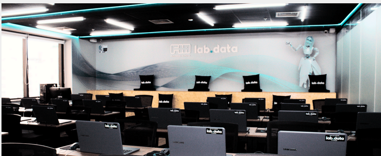
Área para Networking

A parceria LABDATA e GoWork traz para o ecossistema do coworking, um núcleo de educação executiva, onde pesquisadores, empreendedores e estudantes contribuem para a maximização dos resultados criando um ambiente de busca por conhecimento, sintetizado em muitos eventos, hackathons, aulas de alto nível e amplo espaço para networking. Localizado na Avenida Paulista , nossos laboratórios contam com equipamentos de última geração, conforto e segurança para nossos alunos e professores.