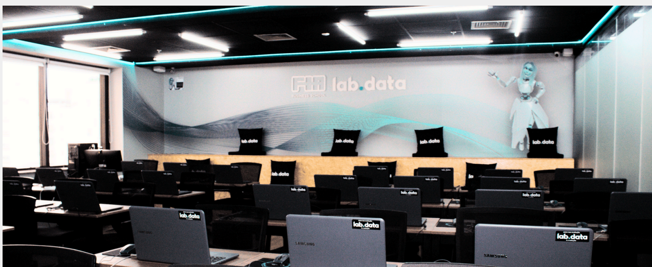
Área para Networking

A parceria LABDATA e GoWork traz para o ecossistema do coworking, um núcleo de educação executiva, onde pesquisadores, empreendedores e estudantes contribuem para a maximização dos resultados criando um ambiente de busca por conhecimento, sintetizado em muitos eventos, hackathons, aulas de alto nível e amplo espaço para networking. Localizado na Avenida Paulista , nossos laboratórios contam com equipamentos de última geração, conforto e segurança para nossos alunos e professores.