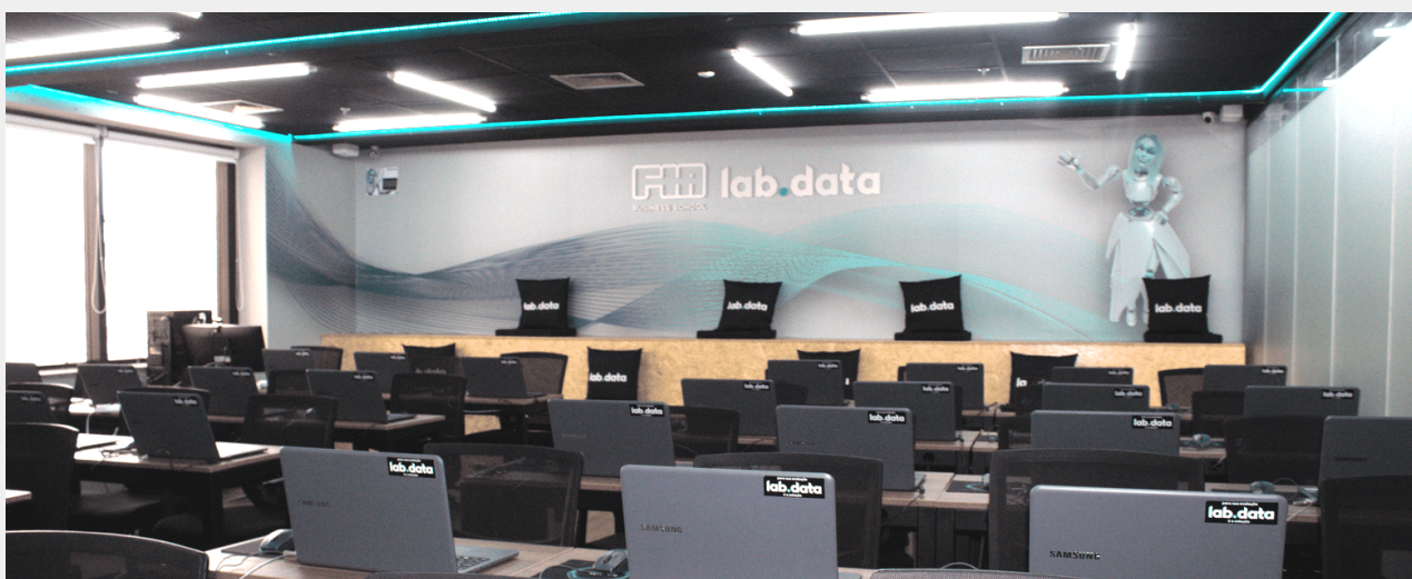
Área para Networking

A parceria LABDATA e GoWork traz para o ecossistema do coworking, um núcleo de educação executiva, onde pesquisadores, empreendedores e estudantes contribuem para a maximização dos resultados criando um ambiente de busca por conhecimento, sintetizado em muitos eventos, hackathons, aulas de alto nível e amplo espaço para networking. Localizado na Avenida Paulista , nossos laboratórios contam com equipamentos de última geração, conforto e segurança para nossos alunos e professores.